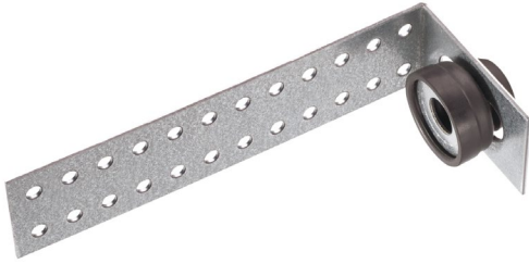
Vibrofix Protector L

УНИВЕРСАЛЬНОЕ ЗВУКОИЗОЛЯЦИОННОЕ КРЕПЛЕНИЕ