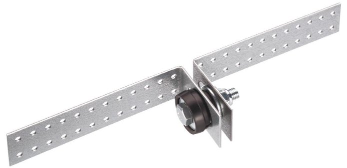
Vibrofix Protector C

Vibrofix Protector L представляет собой металлический L-образный кронштейн с упругим элементом тороидальной формы на основе синтетического каучука. L-образный кронштейн изготовлен из прочной оцинкованной стали толщиной 1,5 мм.