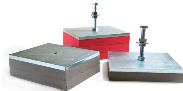
Vibrofix Level Pro

Виброопоры Vibrofix Level Pro изготовлены из прочной оцинкованной стали толщиной 10 мм. На верхней металлической пластине предусмотрено отверстие с резьбой под шпильку диаметром M12. В качестве упругого элемента применяется полиуретановый эластомер (Getzner Werkstoffe, Австрия), специально разработанный для решения задач в области виброзащиты. Виброопоры не нуждаются в техническом обслуживании в течение всего периода эксплуатации, обладают отличными показателями по остаточной деформации упругого элемента, отличаются стабильностью характеристик и высокой устойчивостью к статическим и динамическим нагрузкам.