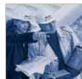
Dach und Fassade